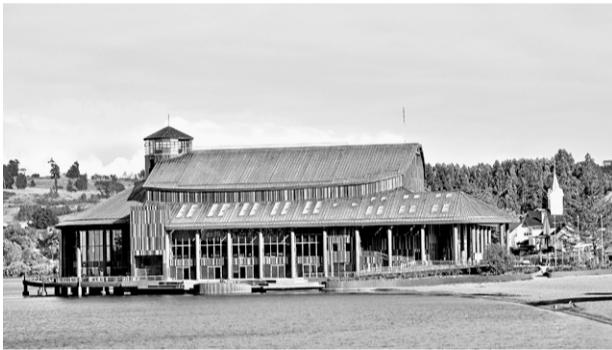
►► El Teatro del Lago anuncia hoy su temporada.

Rilling, el maestro de coros de Stuttgart, que a la larga se transformaría en uno de los dos o tres más grandes intérpretes de Bach en el mundo, transitó aquel camino con una autoridad que le ha llevado a grabar dos veces las más de mil creaciones del compositor en el terreno del coro y la orquesta. Con 78 años, Helmuth Rilling se encuentra en la fase final de su carrera, grabando lo último que le queda por registrar, visitando los lugares donde cree puede sembrar cierta semilla barroca y, coherentemente, sentando las bases de su Academia Internacional Bach de Stuttgart en el mundo.